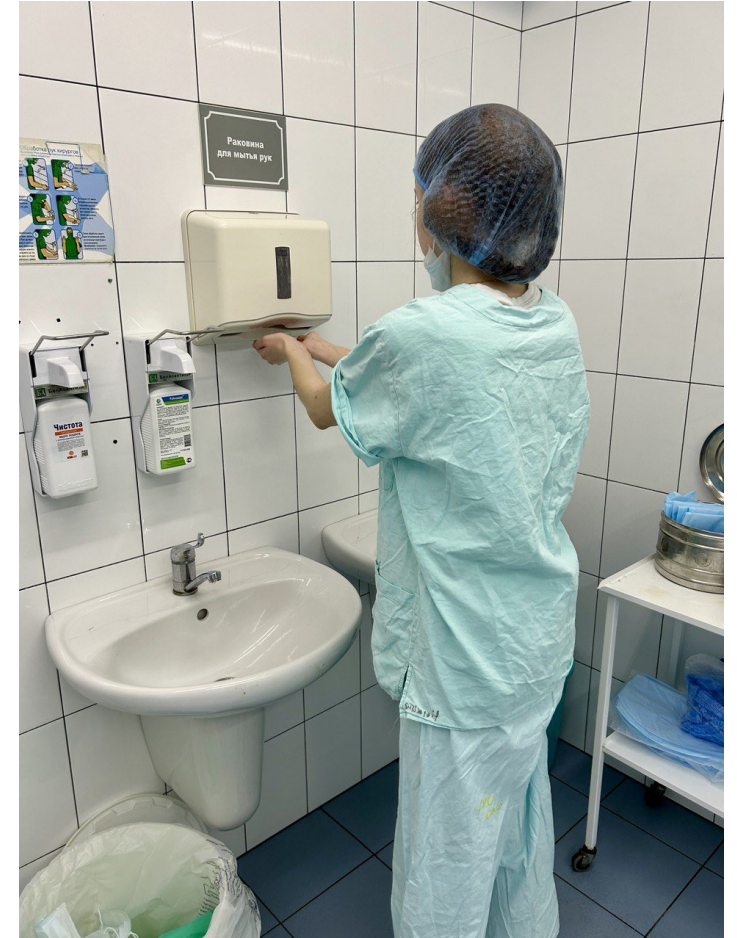
Практика в НИИ хирургии и неотложной помощи