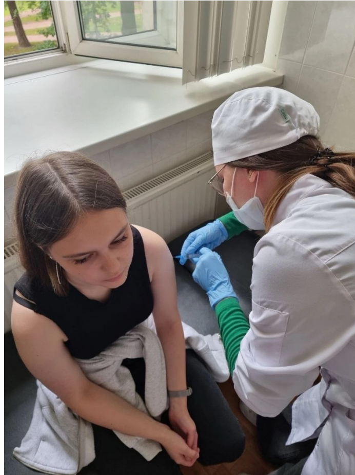
Практика в поликлинике