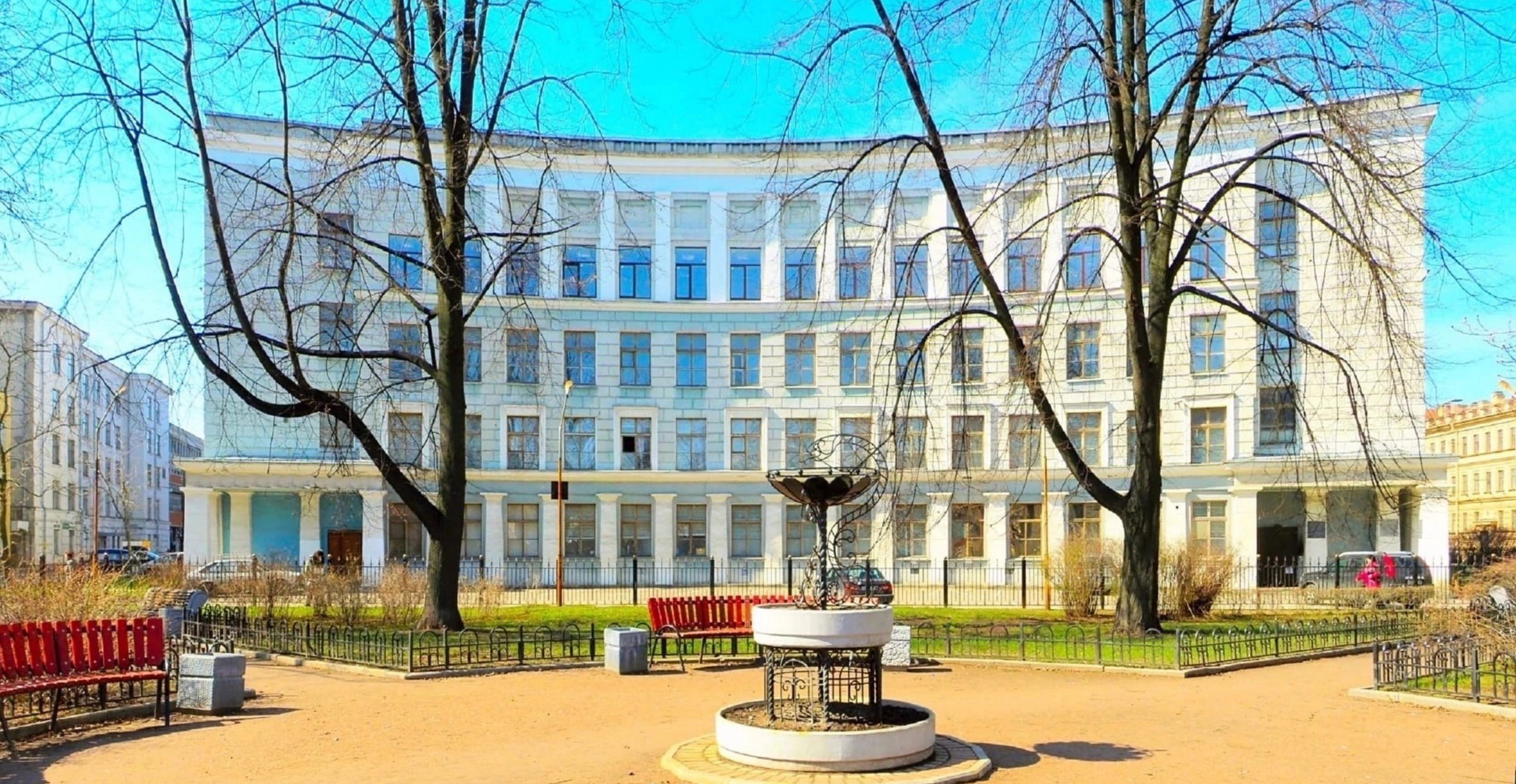
ИНСТИТУТ СЕСТРИНСКОГО ОБРАЗОВАНИЯ