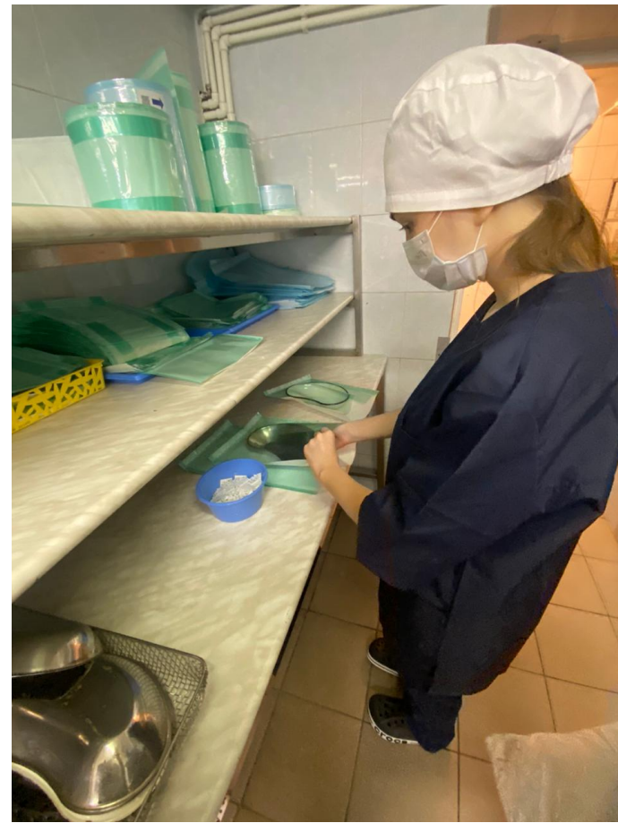
Студентка на практике в ЦСО