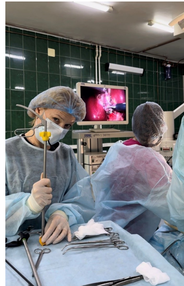
Студентка на практике в ОАИР