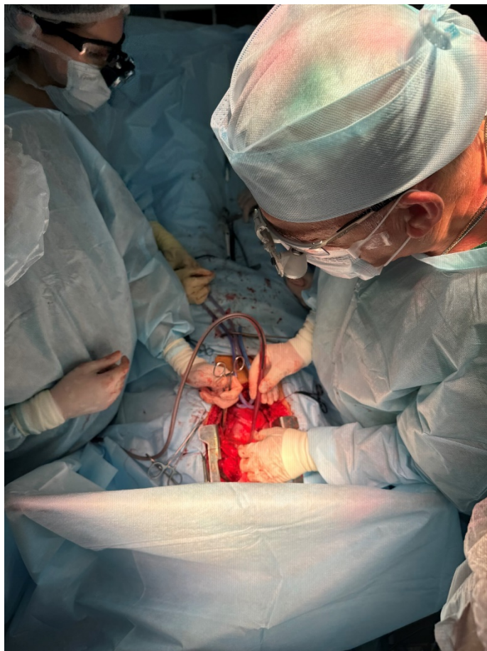
Студентка на практике в ОАИР