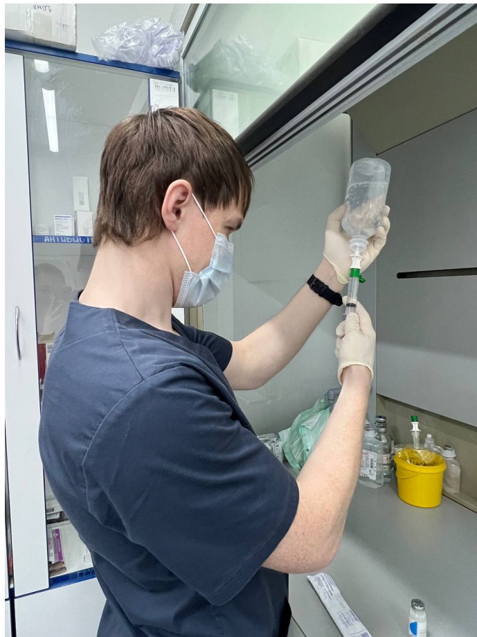
Студент на практике в НИИ детской онкологии, гематологии и трансплантологии им. Р.М. Горбачевой