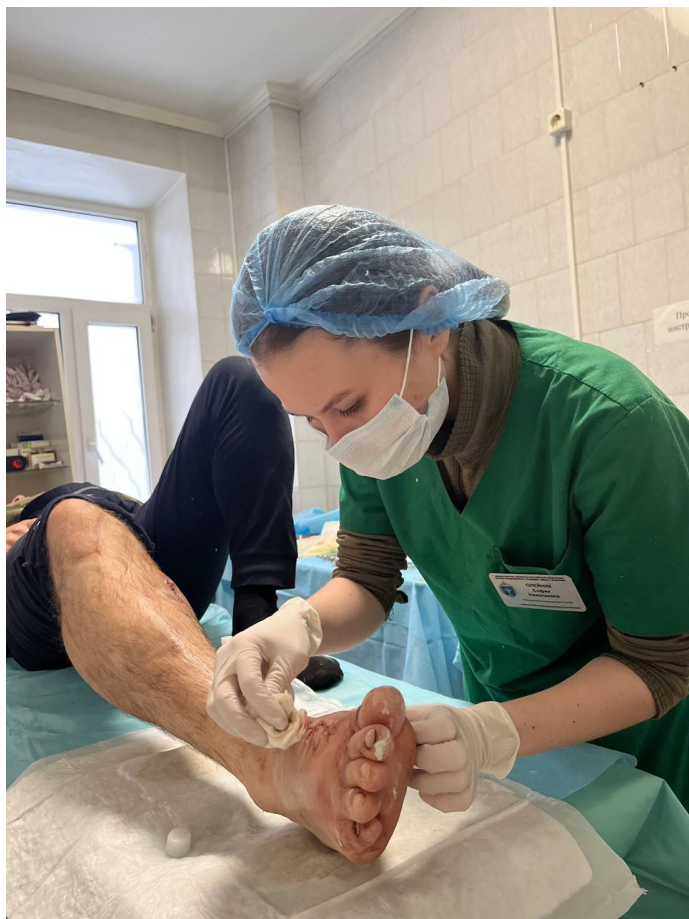
Выпускница медицинского училища в зоне СВО