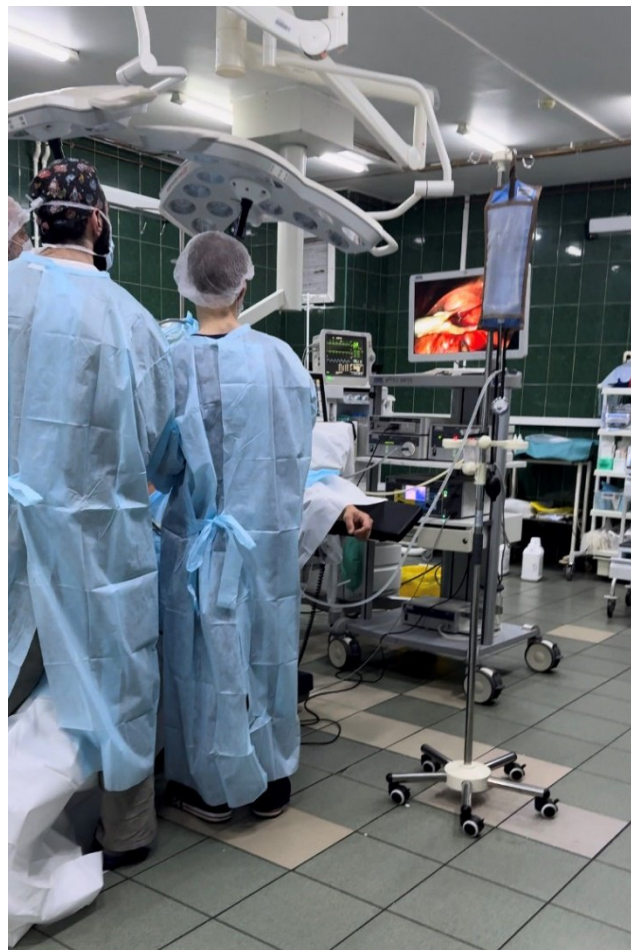
Студент на практике в операционной