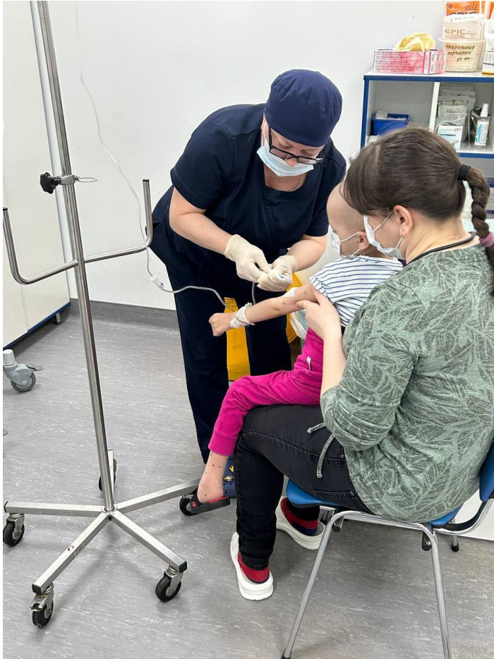
Практика в НИИ детской онкологии, гематологии и трансплантологии им. Р.М. Горбачевой