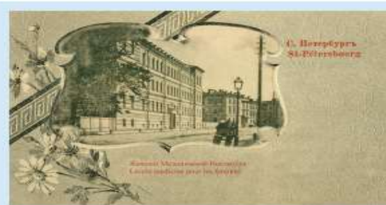
Женский медицинский институт. Открытка. Начало XX в.